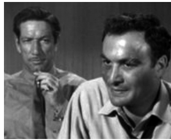
1957 RACKET DANS LA COUTURE (The Garment Jungle) de V. Sherman avec Richard Boone