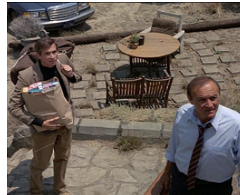
1983 PSYCHOSE 2 (Psycho II) de Richard Franklin avec Anthony Perkins