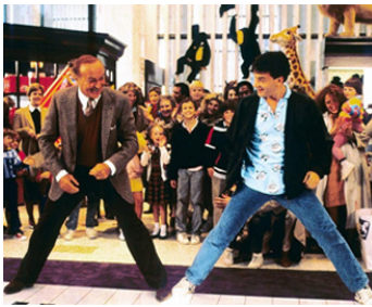
1988 BIG (Big) de Penny Marshall avec Tom Hanks