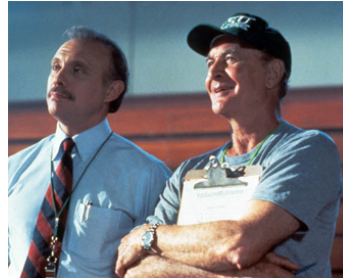
1991 L'ÉQUIPE DES CASSE-GUEULE (Necessary Roughness) de S. Dragoti avec Hector Elizondo