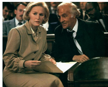
1985 À DOUBLE TRANCHANT (Jagged Edge) de Richard Marquand avec Glenn Close