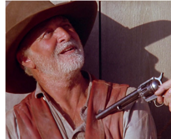
1994 LES BELLES DE L'OUEST (Bad Girls) de Jonathan Kaplan