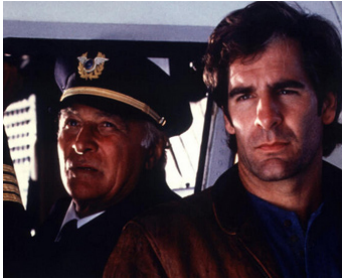
1993 SAUVETAGE EN PLEIN VOL (The Rescue of Flight 771) de Roger Young avec Scott Bakula