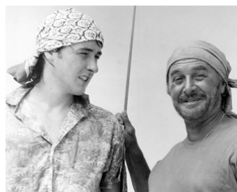
1987 À LA POURSUITE DE LORI (Hot Pursuit) de Steven Lisberger avec John Cusack