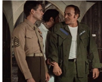
1980 LA CONSTELLATION DES DAMNÉS (The 9th Configuration) de W. Blatty avec S. Powers