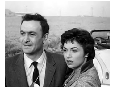
1958 THE LOST MISSILE de William Berke avec Ellen Parker