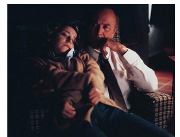
1987 GABY (Gaby: a True Story) de Luis Mandoki avec Rachel Chagall