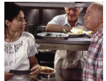
2000 DROIT AU CŒUR (Return to me) de Bonnie Hunt avec Minnie Driver, Carroll O'Connor