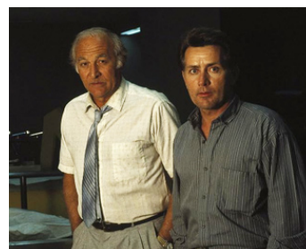
1987 ENVOÛTÉS (The Believers) de John Schlesinger avec Martin Sheen