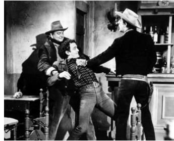
1963 LES RANCHERS DU WYOMING (Cattle King) de Tay Garnett avec R. Middleton, R. Devon