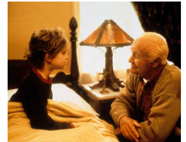
1998 ÉVEIL À LA VIE (Wide Awake) de M. Night Shyamalan avec Joseph Cross