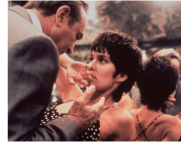
1992 INNOCENT BLOOD (Innocent Blood) de John Landis avec Anne Parillaud