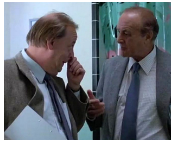
1989 PSYCHO KILLER (Relentless) de William Lustig avec Roy Brocksmith