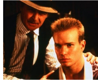
1992 GLADIATEURS (Gladiator) de Rowdy Herrington avec James Marshall