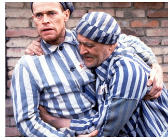
1989 LE TRIOMPHE DE L'ESPRIT (Triumph of the Spirit) de Robert M. Young avec W. Dafoe