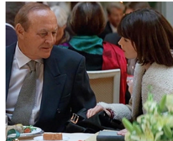
1997 SMILLA (Smilla's Sense of Snow) de Bille August avec Julia Ormond