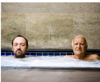
2009 LE PSY D'HOLLYWOOD (Shrink) de Jonas Pate avec Kevin Spacey