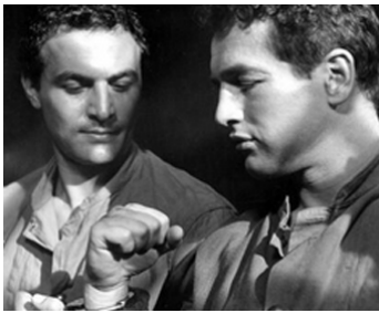
1956 MARQUÉ PAR LA HAINE (Somebody Up There Likes Me) de R. Wise avec P. Newman