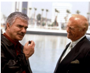
1998 COUP DUR (Hard Time) de Burt Reynolds avec Burt Reynolds