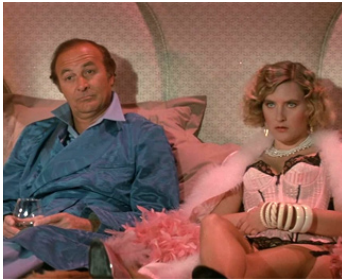
1982 À LA RECHERCHE DE LA PANTHÈRE ROSE (Trail of...) de B. Edwards avec Denise Crosby