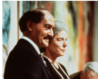
1982 UNE FEMME NOMMÉE GOLDA (A Woman called Golda) d'Alan Gibson avec Ingrid Bergman