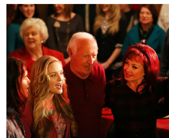
2014 UN NOUVEAU DÉPART POUR NOËL de J. Culver avec Ch. Closshedy, Naomi Judd