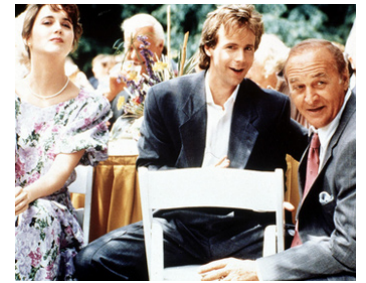
1990 DANS LES POMPES D'UN AUTRE (Opportunity Knocks) de Donald Petrie avec Dana Carvey