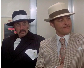
1978 LA MALÉDICTION DE LA PANTHÈRE ROSE (Revenge of...) de B. Edwards avec P. Sellers