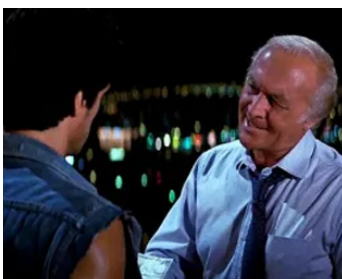
1987 OVER THE TOP, LE BRAS DE FER (Over the Top) de Menahem Golan avec S. Stallone