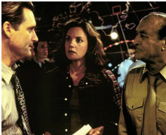
1996 INDEPENDENCE DAY de Roland Emmerich avec Bill Pullman, Margaret Colin