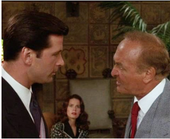
1991 LA CHANTEUSE ET LE MILLIARDAIRE (The Marrying Man) de J. Rees avec A. Baldwin, E. Shue