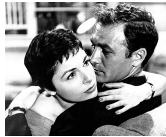
1958 UN TUEUR SE PROMÈNE (Cop Hater) de William Berke avec Ellen Parker