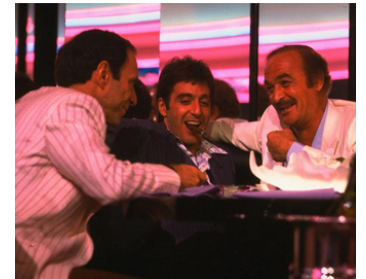
1983 SCARFACE (Scarface) de Brian De Palma avec F. Murray Abraham, Al Pacino