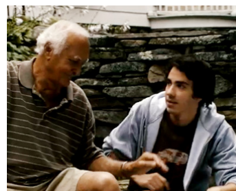
2010 HARVEST (Harvest) de Marc Meyers avec Jack Carpenter