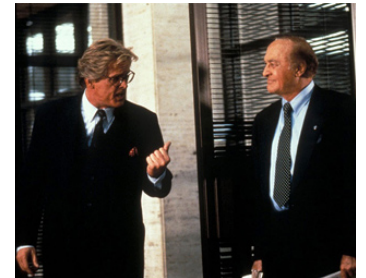
1994 LES COMPLICES (I Love Trouble) de Charles Shyer avec Nick Nolte