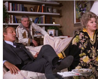
1981 S. O. B. (S.O.B.) de Blake Edwards avec Robert Webber, Shelley Winters