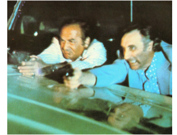
1977 LA FOLLE CAVALE (Speedtrap) d'Earl Bellamy avec Timothy Carey