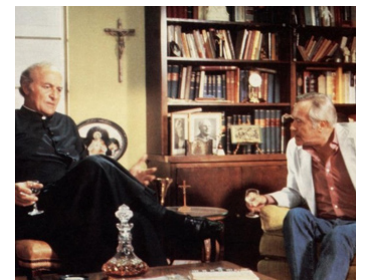
1986 THAT'S LIFE (That's Life) de Black Edwards avec Jack Lemmon