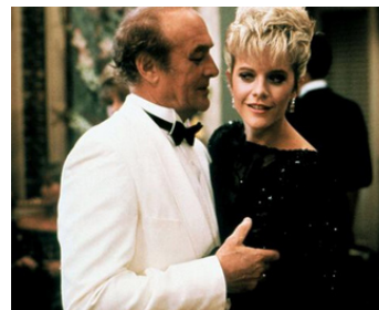
1986 ARMÉ ET DANGEREUX (Armed and Dangerous) de Mark L. Lester avec Meg Ryan