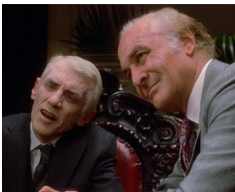
1985 L'HONNEUR DES PRIZZI (Prizzi's Honor) de John Huston avec William Hickey