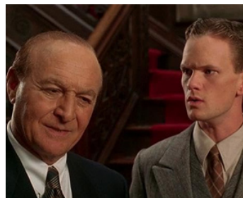
1998 LA PROPOSITION (The Proposition) de Leslie Linka Glatter avec Neil Patrick Harris