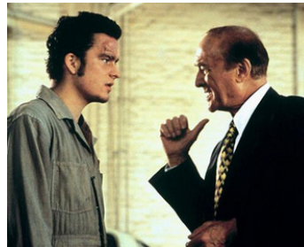
1997 LOST HIGHWAY (Lost Highway) de David Lynch avec Balthazar Getty