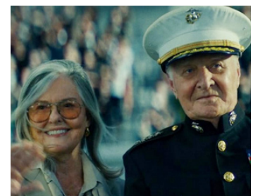
2016 INDEPENDENCE DAY: RESURGENCE de Roland Emmerich avec Audrey Loggia